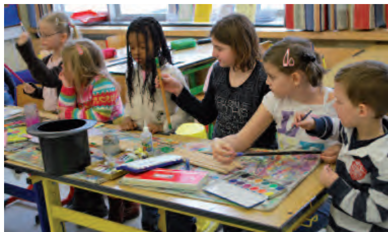
Djeca iz vrtića u posjeti školi u okviru jednog projekta saradnje